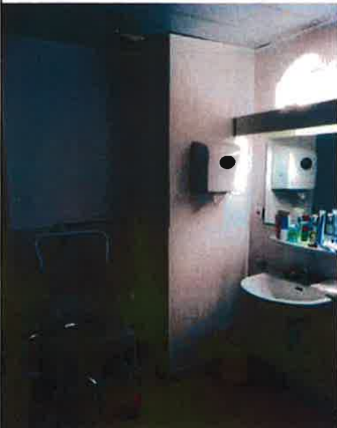
Salle d'eau de l'Ehpad avant travaux

Le nombre de personnes concernées varie en fonction de la durée des séjours. Par ailleurs, le projet s'adresse à deux catégories de publics : les résidents de l'Ehpad qui sont pour la plupart originaires du bassin menton-