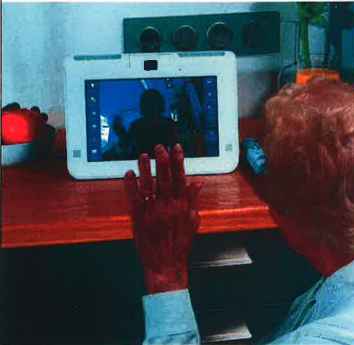
Écran tactile d'une chambre de l'Ehpad ou d'un des hôtels

sonnes âgées et de l'autonomie. L'objectif est la labellisation officielle du dispositif, car le projet a pour ambition d'obtenir une reconnaissance du concept et de son caractère novateur, afin de pouvoir le modéliser et le reproduire dans d'autres villes. Dans cette optique, le Centre national de référence santé à domicile et autonomie (CNR), qui a été missionné par madame DELAUNAY pour créer un référencement des produits et services destinés aux seniors, a initié un groupe de travail auquel l'Ehpad et le syndicat des hôteliers de Menton participeront.