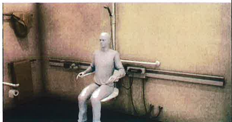
Aménagement de la salle d'eau de l'Ehpad ou d'un des hôtels