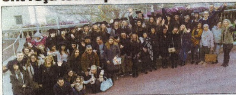
Les 37 infirmiers et 30 aide-soignants viennent d'être diplômés de l'institut de formation aux soins de l'hôpital La Palmosa.