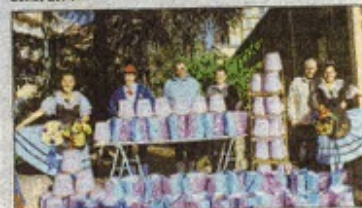
Les membres de la Commune Libre du Careï et de la Mentonnaise fidèles à leur tradition de bienfaisance au moment des fêtes de Noël.

Le bureau et le groupe « Arts et Traditions La Mentonnaise » s'apprêtent à franchir la nouvelle année avec beaucoup d'entrain et d'optimisme et vous donnent rendez-vous en 2018 avec la galette des rois offerte aux enfants des classes de maternelle du groupe scolaire Jeanne-d'Arc et l'assemblée générale statutaire de l'association. Bonne année!